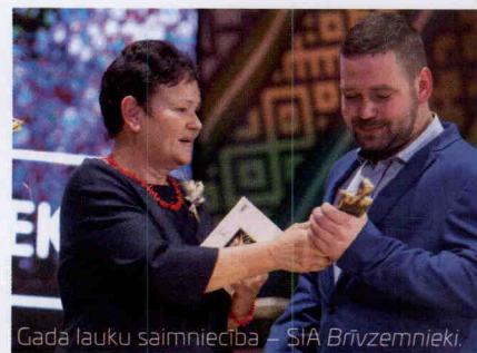
Gada lauku saimniecība – SIA Brīvzemnieki.